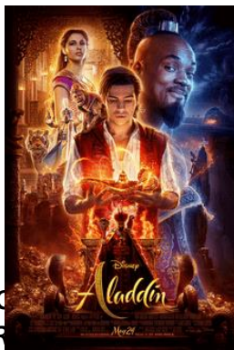
“Pembahasan Film Aladdin” 2019.

Film Aladdin memiliki dua versi yaitu versi pertama adalah film animasi Disney yang berjudul Aladdin yang tayang pertama kali pada tahun 1992 dan versi kedua, adalah film remake dari Aladdin