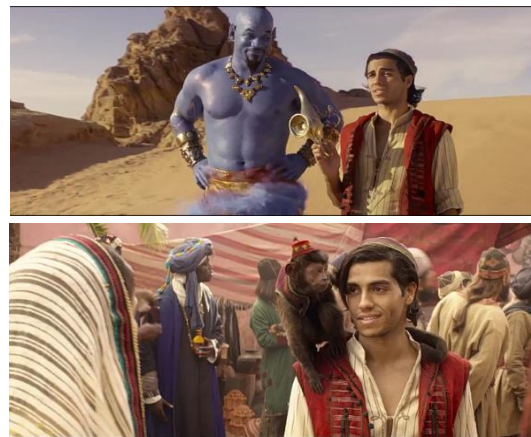
Gambar 7 dan 8 Tokoh Abu dan Genie sebagai “Sidekick” dalam film Aladdin

Singkat cerita peran sidekick dalam film Disney Aladdin bukan hanya sebagai unsur komedi namun bisa dikatakan sebagai penambahan pesan dan nilai moral, seperti tentang persahabatan dan tolong-menolong.