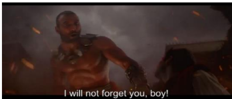
Gambar 8. Momen kehancuran tokoh Jafar dalam Film Aladdin.

Dalam Film Aladdin, kehancuran tokoh Jafar diakibatkan oleh ulahnya sendiri yang haus akan kekuasaan. Kehancuran tokoh Jafar dalam film Aladdin dapat menjadi sebuah simbol hancurnya sistem patriarki di dalam cerita Aladdin ini karena tokoh Jafar adalah yang selalu merendahkan Jasmine dan menghasut sang Sultan untuk tidak pernah memberikan Jasmine kebebasan untuk mengambil sikap dan tindakan.