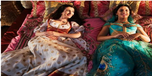
Gambar. 7. Busana Putri Jasmine yang ikonik.

Salah satunya adalah busana ikonik milik Jasmine, yaitu atasan berwarna hijau turquoise dan celana haremnya merupakan juga identitas Jasmine dalam dunia “princess” Disney. Dalam film live action nya, busana tersebut juga dihadirkan namun ditambahkan korset berwarna nude dan tambahan krsital dan bordir dari benang emas untuk motif bulu merak. Penambahan detail dari busana Jasmine tersebut merupakan sebuah simbol terperangkapnya (Jasmine) didalam dunia yang megah, namun dia