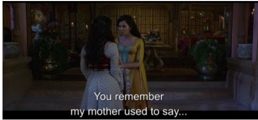
Gambar 2. Putri Jasmine dan Pembantunya Dalia

Pada kutipan diatas tersirat bagaimana putri Jasmine sangat mengidolakan ibunya dan ia menjadi perempuan yang tangguh karena dia belajar dari sosok sang ibu. Semangat ibunya membuat Jasmine memiliki kepercayaan diri untuk berusaha meyakinkan sang ayah agar kelak mau memberikannya gelar sultan dan memimpin Agrabah kepada dirinya. Putri Jasmine tahu dia mampu dan kalimat Dalia yang menyebutkan “ but you’d prefer that boy from the market, ” membuat pembaca mengerti bahwa karakter putri Jasmine (karakter putri Disney saat ini) lebih menyukui seseorang dengan karakter yang baik walaupun dia bukan seorang pangeran. Sehingga menurut penulis karakterisasi tokoh memegang hal yang penting pada formula film bertemakan “princess” bagi Disney belakangan ini.